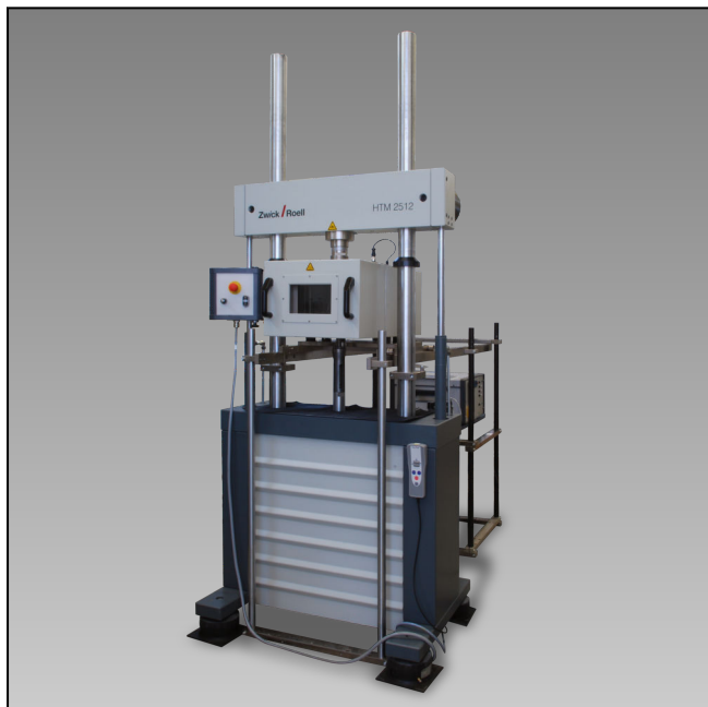
HTM 2512 mit Temperierkammer