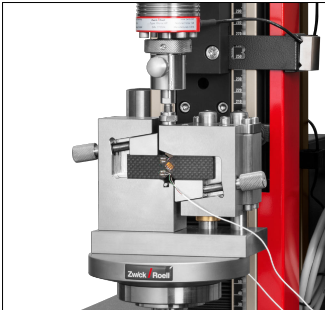
V-Notched Beam (Iosipescu)-Schervorrichtung