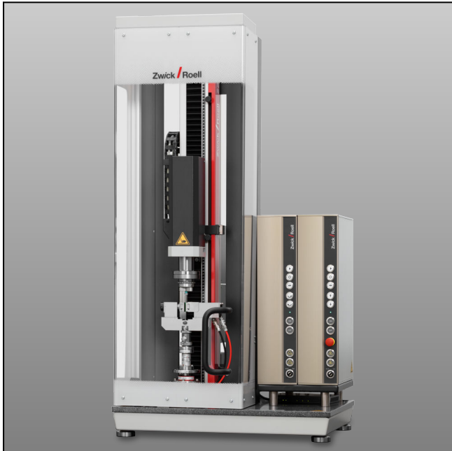
Prüfaufbau mit Pneumatik-Probenhalter und 3-Backenfutter